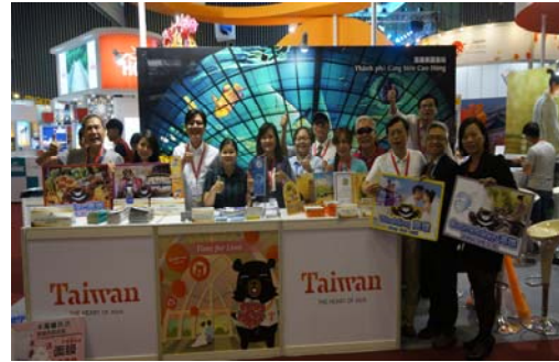
參加胡志明市國際旅展