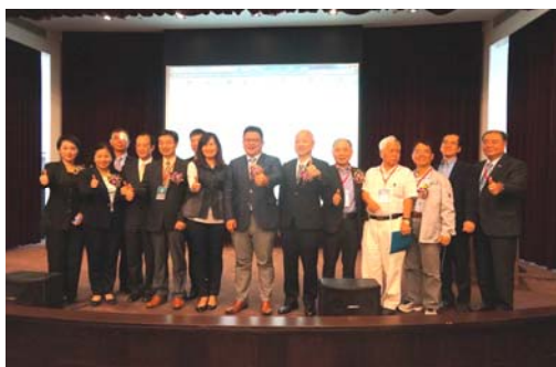
產官學界參與觀光發展座談會