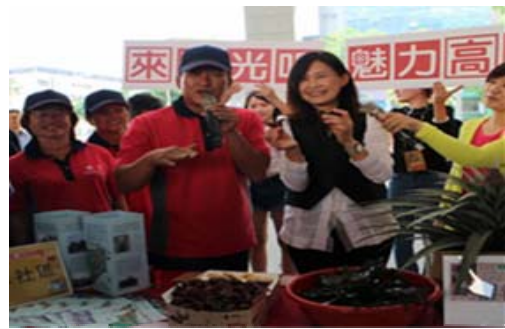
「來觀光吧！魅力高雄」-大寮場活動