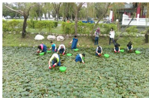
蓮池潭採菱角體驗活動