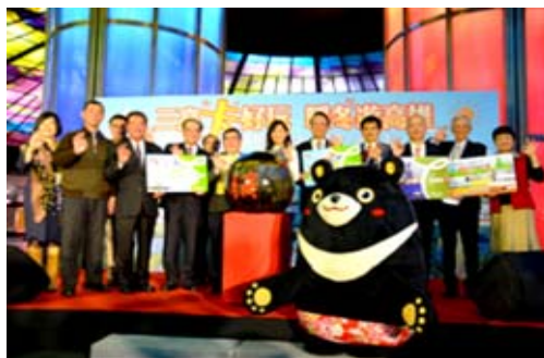
與高鐵、高捷合作好玩卡行銷