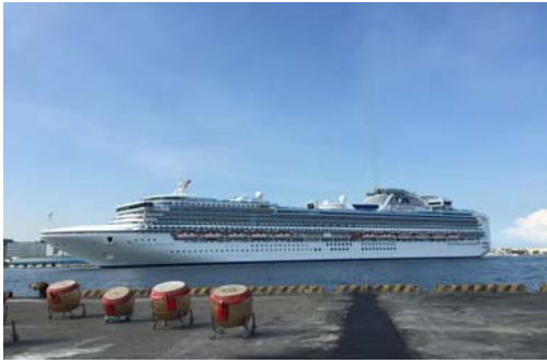
鑽石公主號郵輪進港