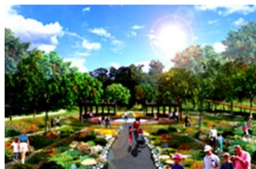
崗山之眼園區週邊環境整建（模擬圖）