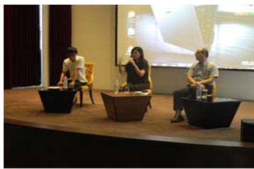
穆斯林友善餐旅認證輔導說明會