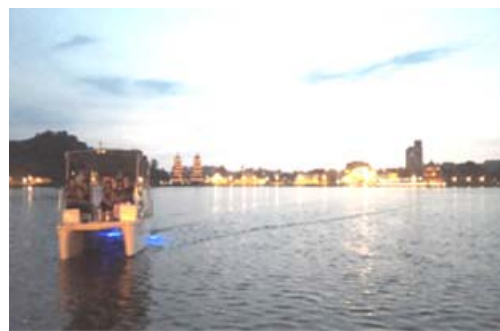
蓮池潭電動船低碳旅遊