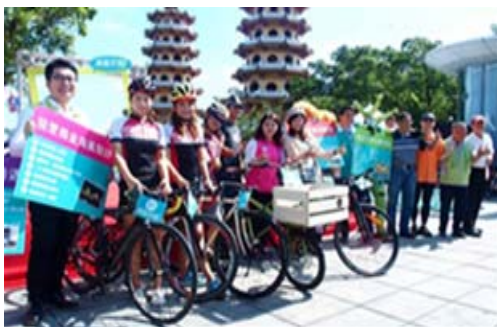
「乘風而騎」單車旅遊活動記者會