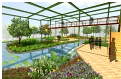
金獅湖風景區整建工程（模擬圖）