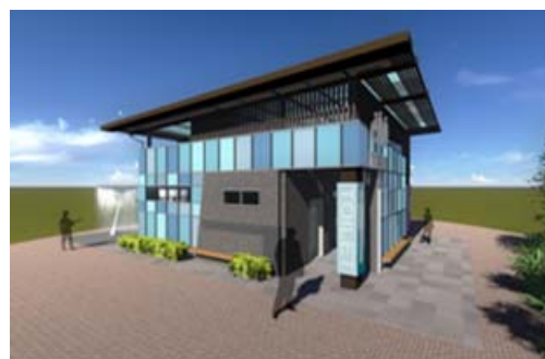
蓮池潭艇庫碼頭公廁整修（模擬圖）