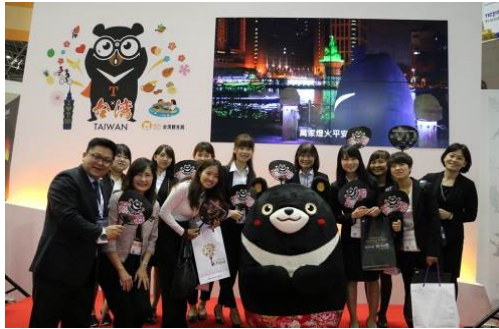
參加日本東京旅展及推廣活動