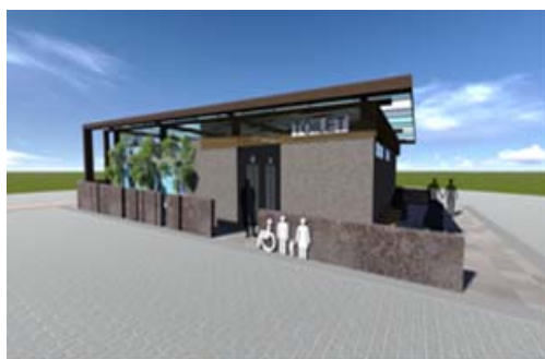
蓮池潭小龜山公廁整修（模擬圖）