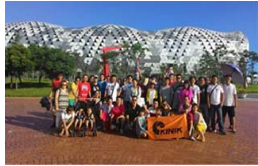
獎勵旅行業推廣高雄旅遊造訪新光碼頭