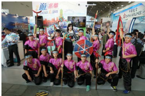
參加高雄市旅行公會冬季國際旅展