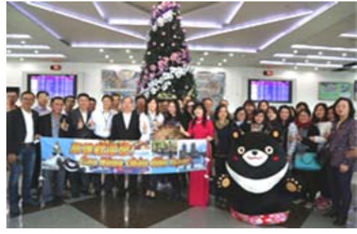
越捷航空「高雄-胡志明」首航迎賓