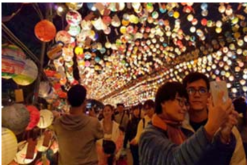
高雄燈會藝術節燈海

自105年2月公告至12月底，共有25家旅行社申請總金額計約200萬元，計帶來67團，400輛遊覽車，約12,341人次到訪高雄旅遊景點，創造約3,700萬元觀光產值。