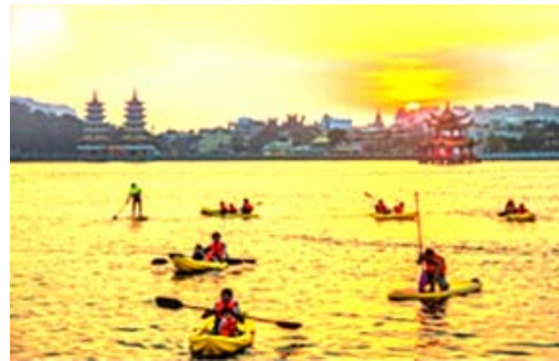
「揪愛水高雄」水域遊憩體驗活動