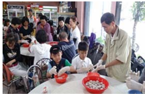
「四季逍遙遊」彌陀漁村體驗