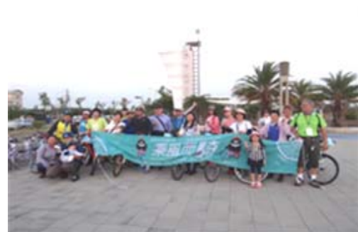
「乘風而騎」單車旅遊造訪茄萣