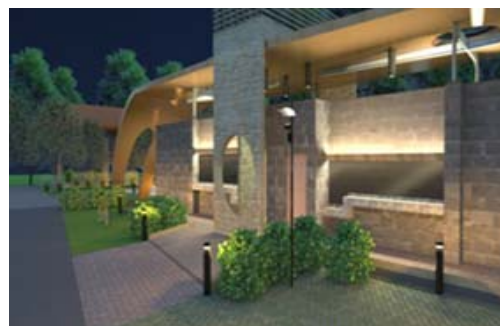
西子灣旅客服務中心新建及周邊環境工程（模擬圖）