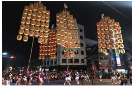
萬人提燈大遊行表演活動