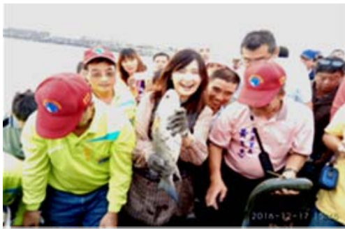
「來觀光吧！魅力高雄」-林園場活動