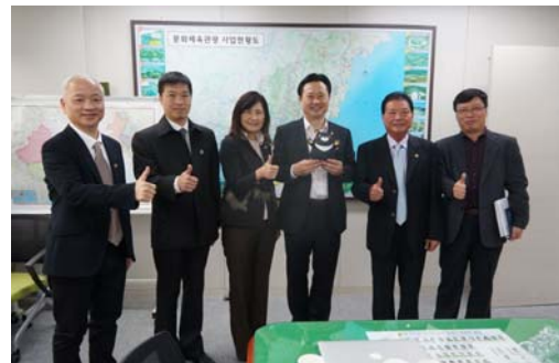
拜會釜山文化觀光局洽談觀光交流議題