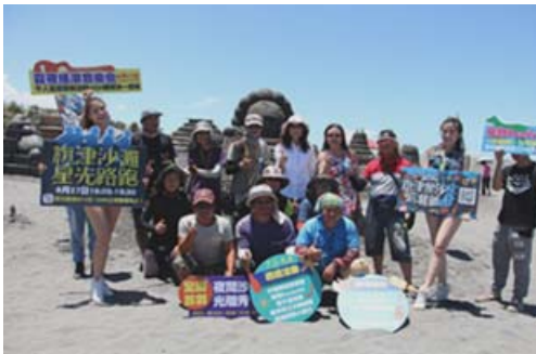
旗津黑沙玩藝節活動