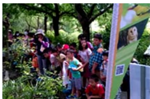
烏松濕地志工提供導覽解說服務