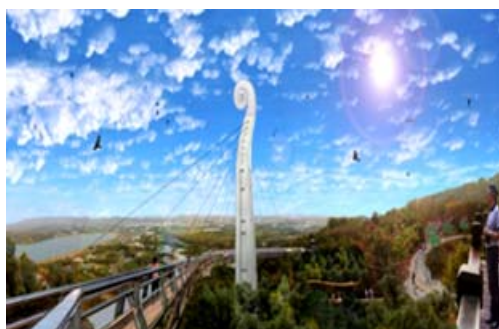
崗山之眼園區整建工程（模擬圖）