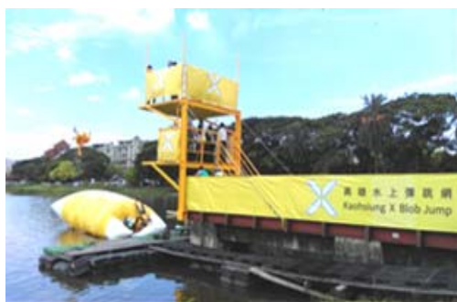
蓮池潭水上彈跳新型態活動