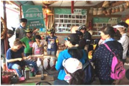
「乘風而騎」單車旅遊美濃紙傘體驗