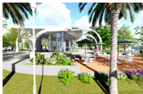
西子灣旅客服務中心新建及周邊環境整建（模擬圖）