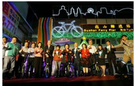
「聖誕燈節就在哈瑪星」活動