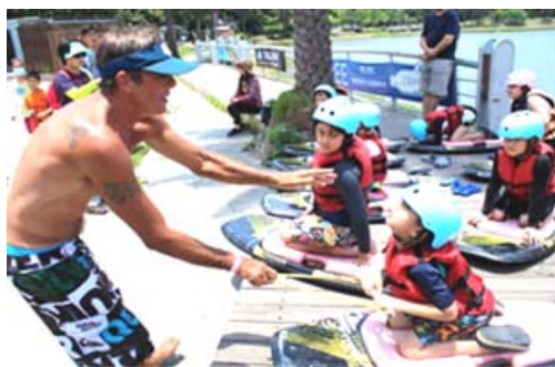
蓮池潭纜繩滑水營隊活動