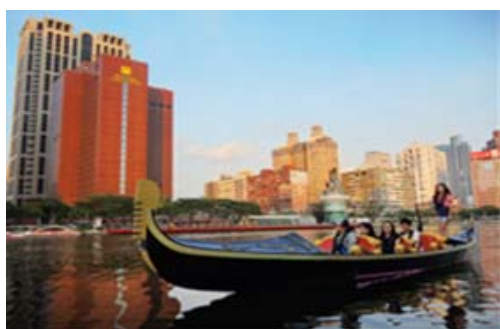
貢多拉船浪漫遊愛河