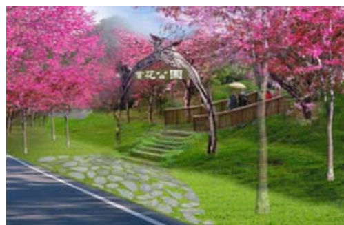
寶來賞花環境營造工程（模擬圖）