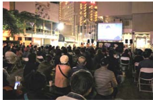
露天咖啡電影之夜吸引參加人潮