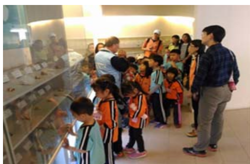
旗津貝殼館志工提供導覽解說服務