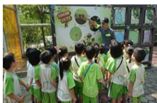
金獅湖蝴蝶園志工提供導覽解說服務