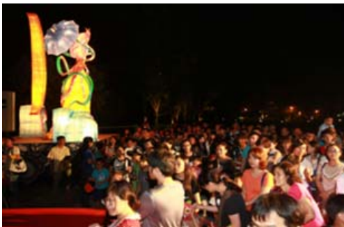
田寮奇幻月世界活動