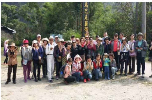
「四季逍遙遊」茂林賞蝶生態之旅