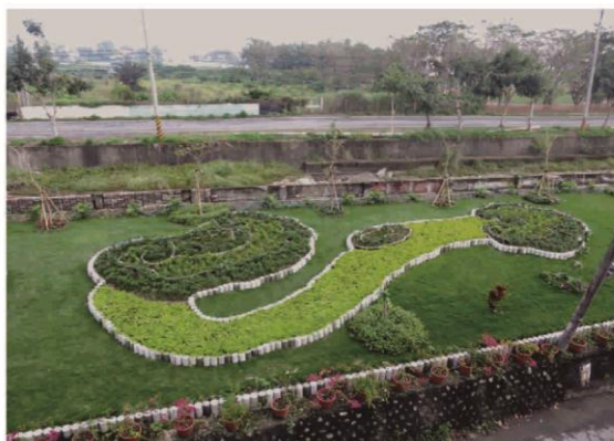
鼓勵社區居民主動參與公共空間環境改造，補助社區辦理閒置空間維護清理及綠美化，營造清淨家園。